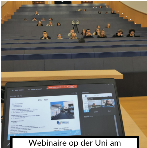
Webinaire op der Uni am Hybrid Format den 20.02.2023

Eist SCOME Team war och dëst Joer scho fläisseg an huet op Studieninfoen a verschiddene Lycéeen, Schüler*innen de Medezinstudium, d'Umellung an hier Optionnen erklärt. Dës Eventer sinn ëmmer eng flott Geleegeheet Froen vu zukünftege Medezinstudéierend ze beäntweren an och nei Schüler*innen fir d'Medezin ze begeeschten.