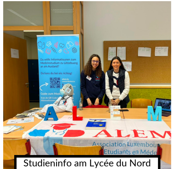
Studieninfo am Lycée du Nord zu Woltz den 25.02.2023